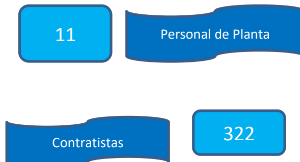
Gráfico 1. Información contratación 30/06/2023

Con base en la información suministrada por la Subdirección Administrativa y Financiera en relación al personal de planta, y la Subdirección jurídica en materia de contratos de orden de prestación de servicios, se tiene el siguiente reporte: