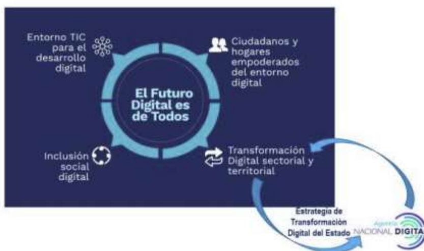
Ilustración 1. Ejes Plan Estratégico Sectorial

Este contexto estratégico se encuentra enmarcado en el Plan Estratégico Sectorial: