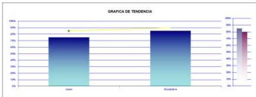
Ilustración 5. Hoja de Gráficas, Gráfica de Tendencia